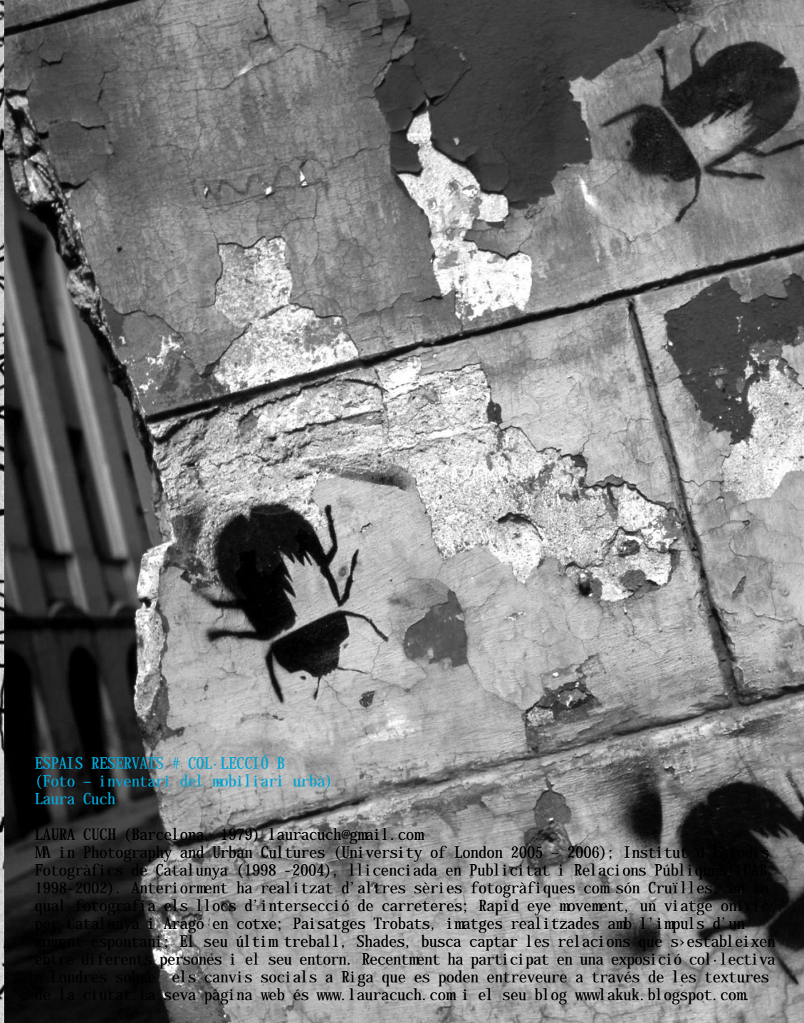
ESPAYS RESERVATS. # COL·LECCIÓ B